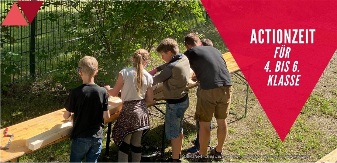
Ganzheitliches Lernen beim Schleifen des neuen Rolltisches

Auch bei uns in der Actionzeit (Jungschar) geht ein Schuljahr zu Ende. Gemeinsam mit sechs bis acht Kindern und wechselnden Praktikanten war dieses Jahr gefüllt mit Spiel und Spaß, biblischem und lebensnahem Tiefgang und gemeinsamen Aktionen.