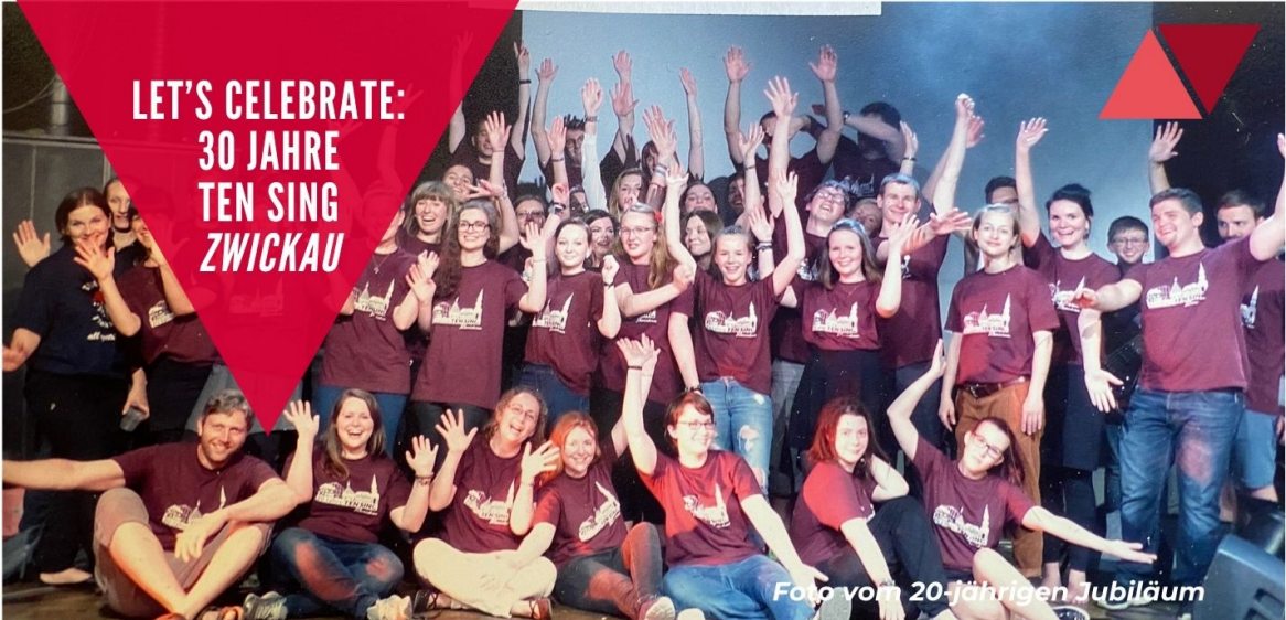
Foto vom 20-jährigen Jubiläum